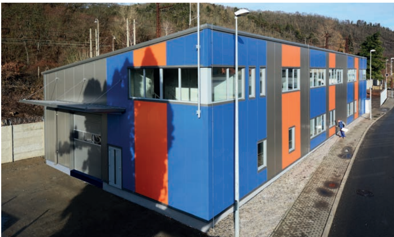
Montovaná hala JL Transport

Unihal kreslí montované haly v sofistikovaném programu 3D TEKLA Structures, který zajistí přesnou výrobní a montážní dokumentaci. V programu se kreslí jak 3D konstrukce, tak i opláštění haly do realizace, což zajistí bezchybnou výrobu a následnou montáž haly.