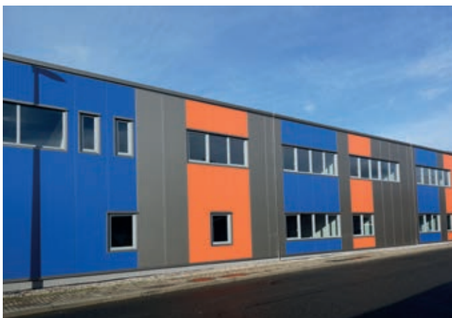
Opláštění haly JL Transport