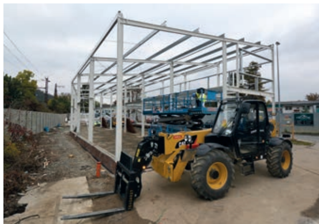
Ocelová konstrukce haly

Ocelová konstrukce je lakovaná v barvě šedobílé RAL 9002, vaznice i stropnice jsou pozinkované. Administrativní část haly má požární odolnost na R30 minut, konstrukce je obložena protipožárním sádkartonem.