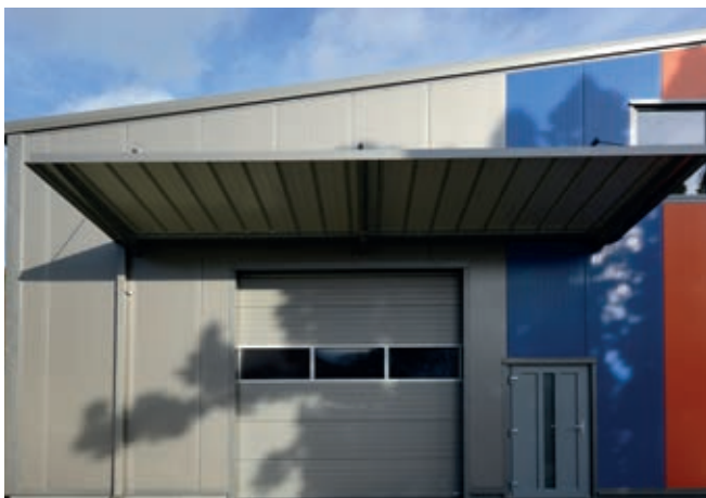
Sekční vrata s přístřeškem