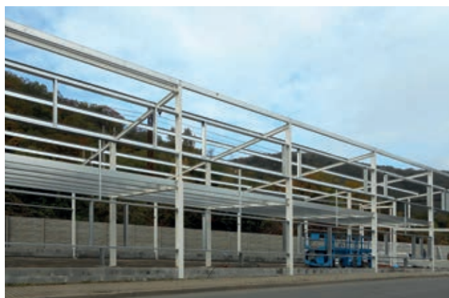
Ocelová konstrukce haly